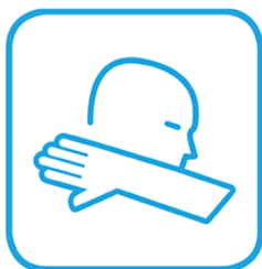
Richtig husten und niesen

Damit wir das Jugendbüro auch in den kommenden Tagen öffnen können ist es wichtig, dass ihr euch an diese Regeln haltet. Wer es nicht schafft, riskiert ein Hausverbot.